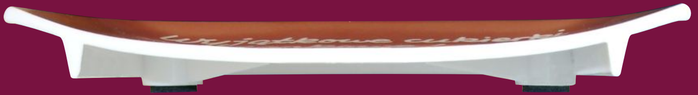
Zahlteiler 104 Schnittansicht 1:1