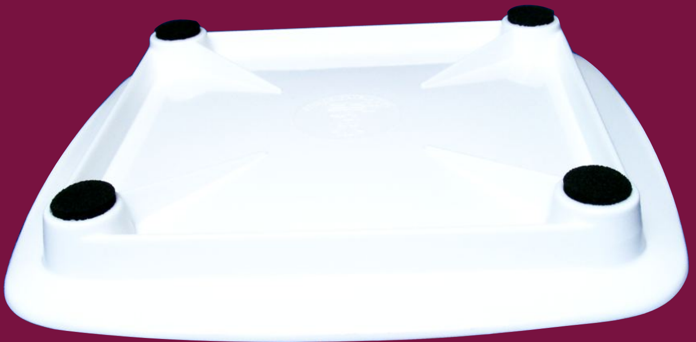
Zahlteiler 104 Rückansicht 1:1